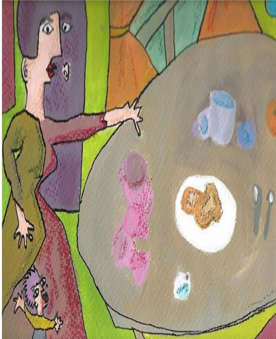
Cuadro de Isabel